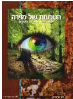
הטבעות של מוירה