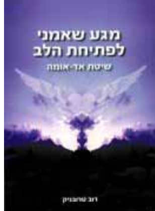
מגע שאמני לפתיחת הלב