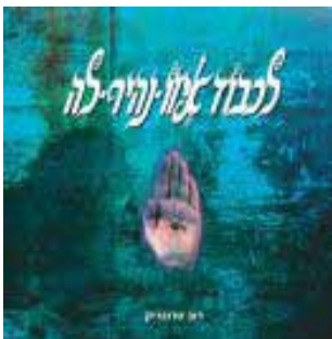
לכבוד איזו נהיר לה