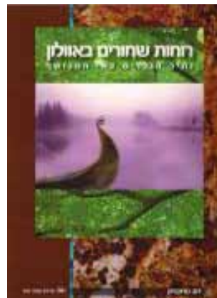
רוחות שחורים באוולון